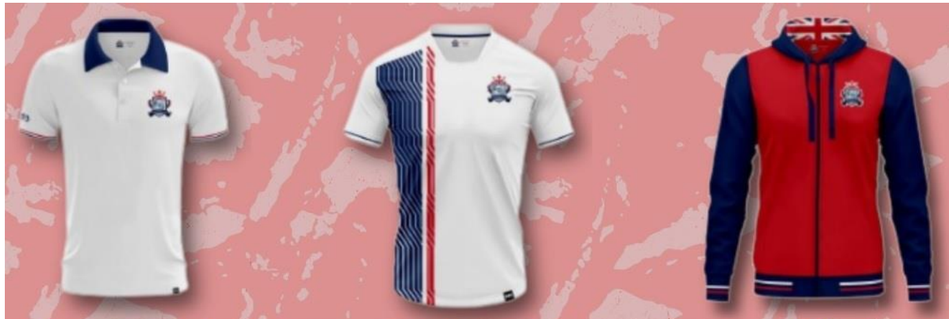
CAMIBUSO DE DIARIO

NUEVO UNIFORME PARA USO A PARTIR DEL AÑO 2024